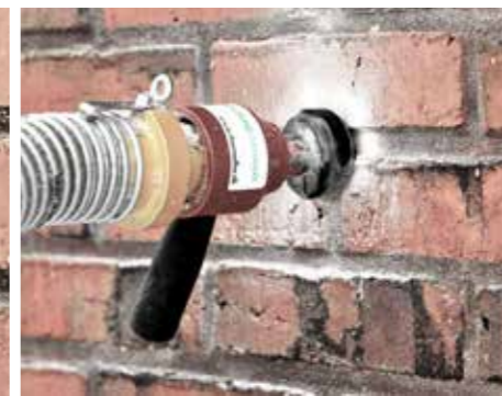
Papirisoleringen blæses ind i hulumuren.