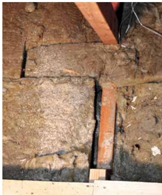
Loft før indblæsning af Themofloc papirisolering