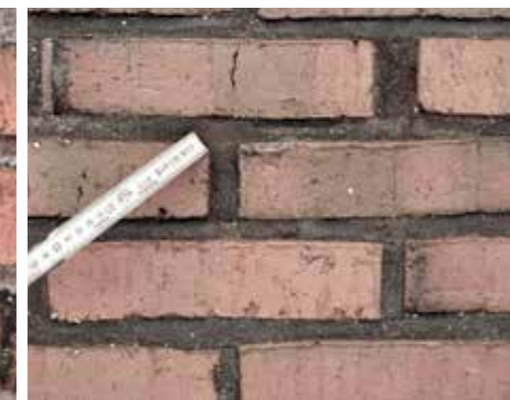
Ilægning af fuge, så det passer i mørtelfarve.