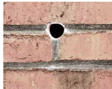
Kun et lille hul i fugen er nødvendig.

Thermofloc papirisolering er et organisk materiale og kan derfor absorbere fugten i en hulmur. Kort sagt vil fugten blive transporteret til et større område i hulumuren og vil blive afgivet igen, når forholdene tillader det. Man undgår derfor fugtskader.