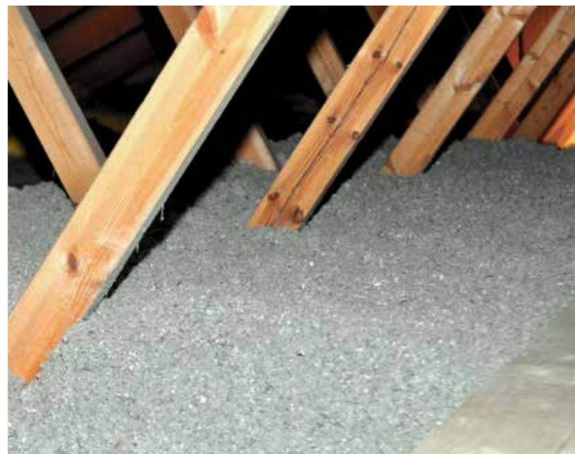
Loft efter indblæsning af Themofloc papirisolering